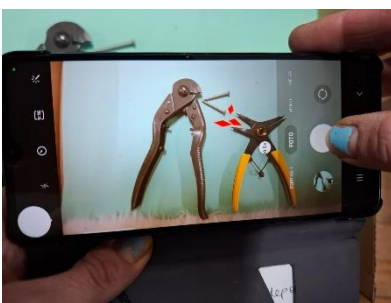
Kreation von Stop-Motion-Kurzfilmen