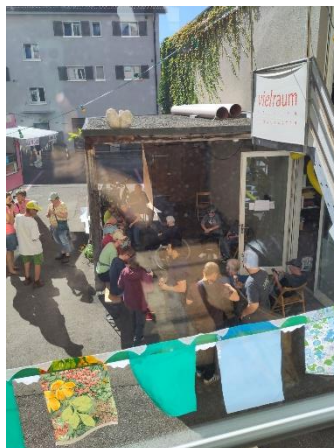
September: Ulmen5 Fest