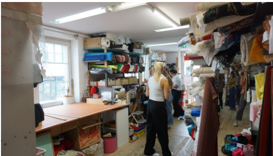
Stöbern im Materialmarkt am Kulturtag