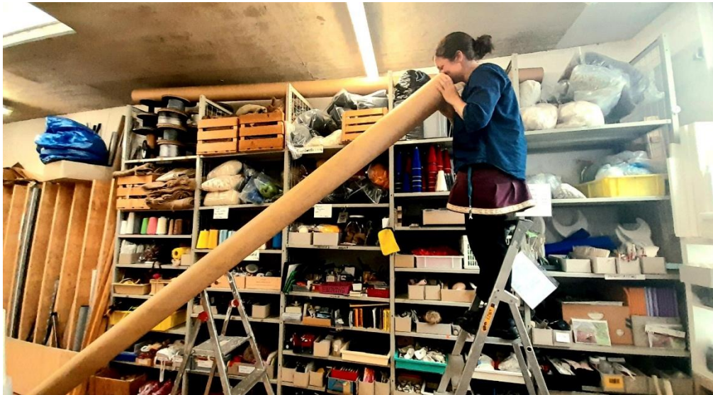
Verschiedenste Materialien finden ihren Platz