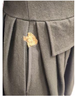
Ergebnisse beim Visible Mending-Workshop