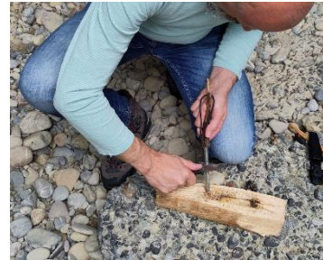
Mai: Vorstandsausflug Ulmen5