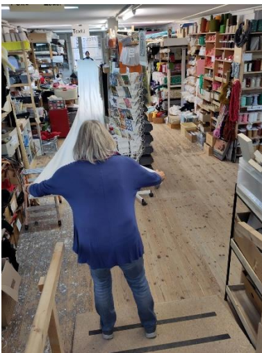
Kundenwunsch: 30 m Stoff