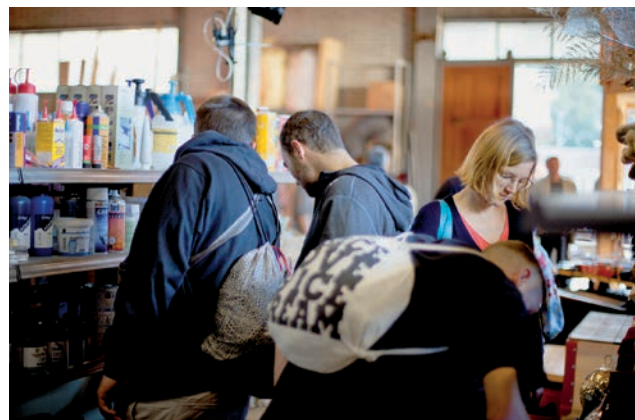
Als Secondhand-Künstler- und Bastelbedarf ist Offcut auch ein Treffpunkt für Kreative auf der Suche nach Inspiration.