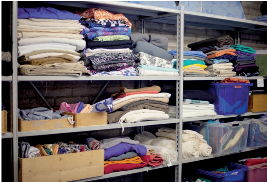
Rohmaterial, das sich wiederverwerten lässt, stapelt sich im Materiallager. Beliebte sind unter anderem farbige Blachen, Bühnenmoltons und andere Textilien.