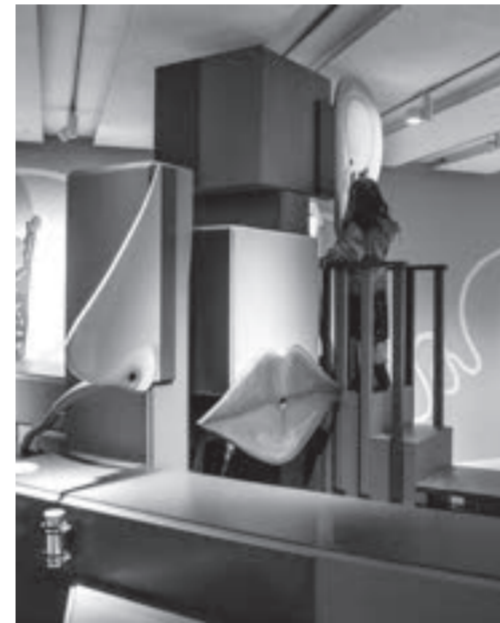
Oktober, OFFCUT Zürich: Das Atelier für nachhaltige Szenografie konzipiert die Sonderausstellung «Immer ich?» im MUKS Riehen und führt die bauliche Umsetzung mit über 90% wiederverwerteten Materialien aus.

An der Generalversammlung im Juni konnten wir die Organisationsstrukturen umsetzen, die wir an der Retraite 2022 angedacht haben. Die Zusammenarbeit soll bedürfnisorientiert und agil organisiert sein, zudem wurden Pflichtrollen für den vitalen Betrieb des OFFCUT-Netzwerks geschaffen.