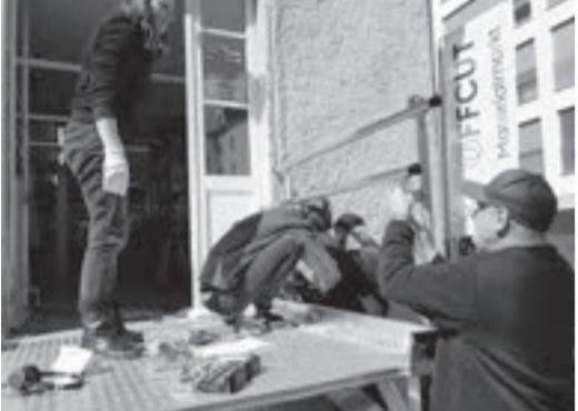
April, OFFCUT St. Gallen: Durch den Bau von drei Rampen sind wir nun fast barrierefrei.