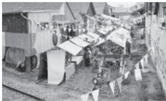
August, OFFCUT Basel: Wunderbare Stimmung am Jubiläumsfest mit einem Markt und einer Kunstausstellung, interessanten Beiträgen von unseren Gästen sowie musikalischen und kulinarischen Köstlichkeiten.