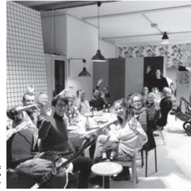
Dezember, OFFCUT Luzern: Der letzte gemeinsame Abend – Dankessen mit unseren grossartigen Helfenden.