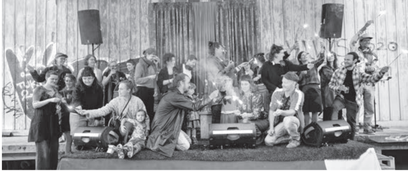
August, OFFCUT Schweiz: Die OFFCUT Familie feierte ihr 10-jähriges Jubiläum mit einem grossen Fest am Gründerstandort Basel.