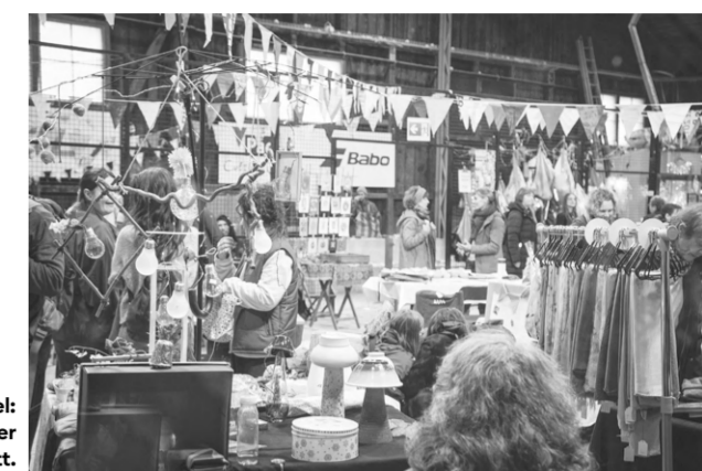
November, Basel: Das dritte Marktfest fand in der Podelhalle statt.