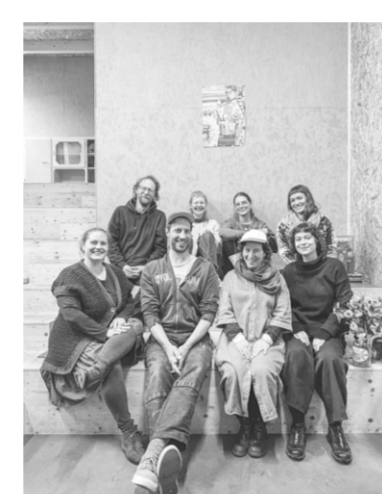
Mai, Basel: Teambild in der Bibliothek.