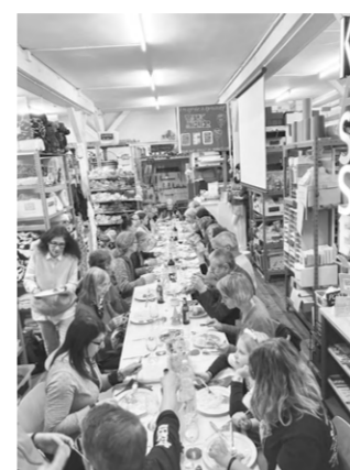
November, Frauenfeld: Helfer*innenessen. Dank vielen Freiwilligen wird der neue OFFCUT Standort eröffnet und betrieben.