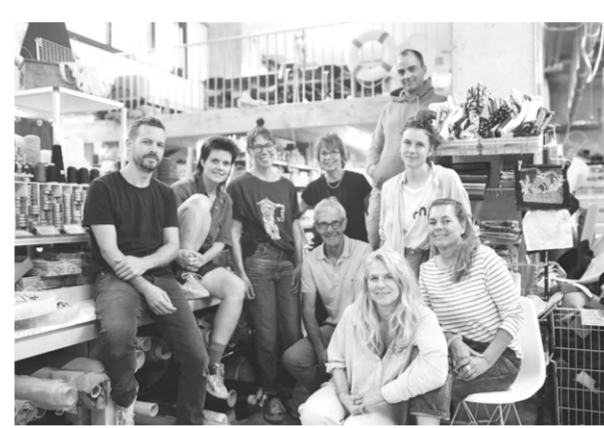
August, Bern: Das Team inklusive neuer Verstärkung anlässlich der Mitgliederversammlung im OFFCUT Bern.

Um uns weiter etablieren zu können, bewarben wir uns als Netzwerk für den Social Impact Catalyst (SIC). Ziel des SIC ist es, wirkungsorientierte Schweizer Unternehmen mit potenziellen Investor*innen zu vernetzen und ein neues Verständnis von Wirkung und Rendite zu schaffen. Als glückliche Finalistin nahmen wir am Investment Readiness Program teil und wurden gezielt auf die Begegnung mit potenziellen Investor*innen vorbereitet. Neben wertvollen Erfahrungen und neuen Kontakten, können wir dank dem SIC ein schweizweites Netzwerk-Projekt im Bildungsbereich umsetzen.