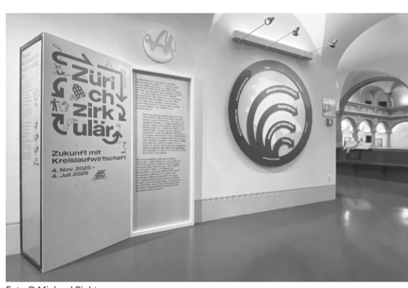
November, Zürich: Das Atelier für nachhaltige Szenografie realisiert die Ausstellung «Zürich zirkulär» zur Kreislaufwirtschaft im Stadthaus Zürich mit.

Aber das grösste Highlight haben wir für den Schluss aufgehoben: Im Mai eröffnete der neue Standort in Frauenfeld. Wir freuen uns über den Zuwachs im Netzwerk und starten vielseitig gestärkt ins neue Jahr!