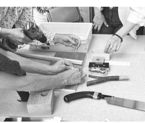
September, Bern und Stücker: Wie weiterbauen mit Holzreststücken? Mitmachangebot an den Nachhaltigkeitstagen Bern.