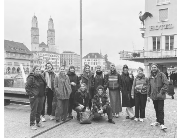
November, OFFCUT Schweiz: Retraite Zürich, Ausstellung Zürich zirkulär. Zukunft mit Kreislaufwirtschaft.