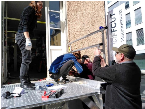
2303: Aufbau Aussenrampe