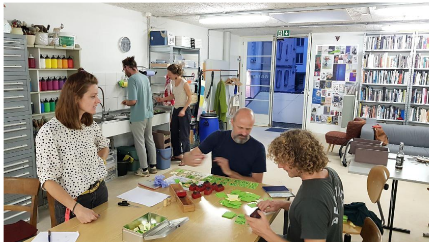
TVorbereitungen Einjähriges Fest