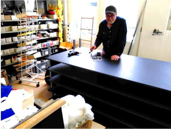
2301: Umbau Materialmarkt