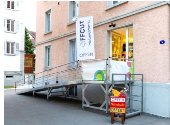
2304: Aussenrampe mit Fahne