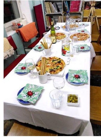
2301: Mitarbeiter- und Helferessen