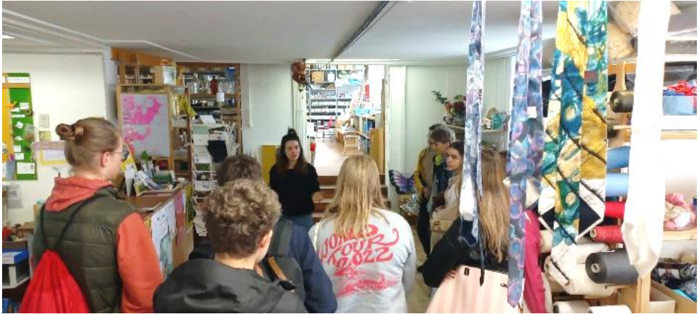
Diverse Führungen und Workshops