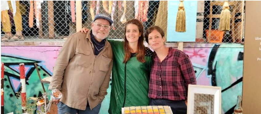
2308: 10-Jahresjubiläum Standort Basel