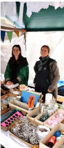
2305: Ökomarkt St. Gallen